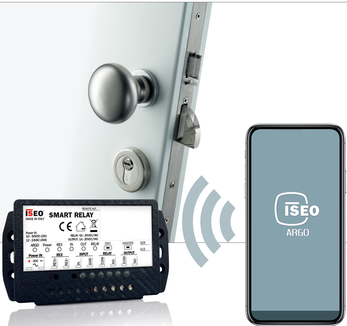
Sistema de apertura de puerta con Smart Relay y Multiblindo eMotion .